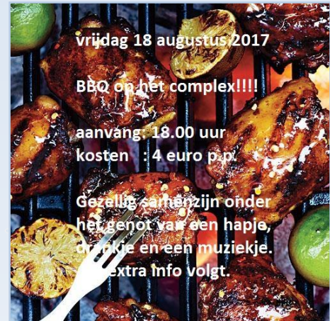
[De BBQ is op vrijdag 18 augustus a.s..]

Vriendelijk verzoek om voor de wat zwaardere materialen uitsluitend gebruik te maken van de stalen bakken. Uiteraard opnieuw het dringend verzoek om de kruiwagens, na gebruik, weer terug te plaatsen op de plek waar deze gepakt is.